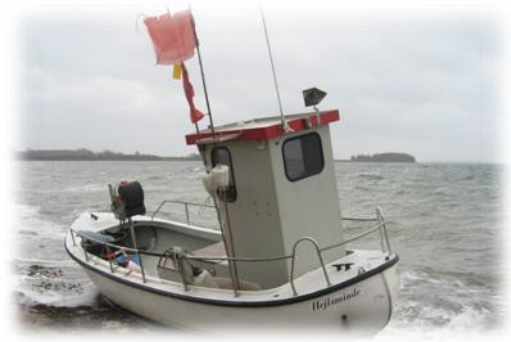
Bent Leth – HVF 246 NORDVESTFYN , 13 APR 08